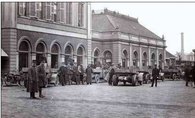
Station Tilburg, 1914-1918.