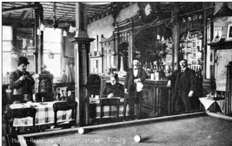
Interieur café-restaurant Albert Janssen, 1911. (Verblijfplaats Onbekend)

Brabant. Een herinneringsbeeld is altijd mooi en de wegen, die door Brabant gaan zijn altijd licht ! Ook 's - nachts! Ook 's - nachts ! Als ik fietste naar Alphen; Goirle; Berkel! Overal scheen dat licht; overal was die stilte die aan de vergetelheid van den Droom herinnert. Het is mij of ik een jaar gedroomd heb. Dat jaar is als één minuut.'